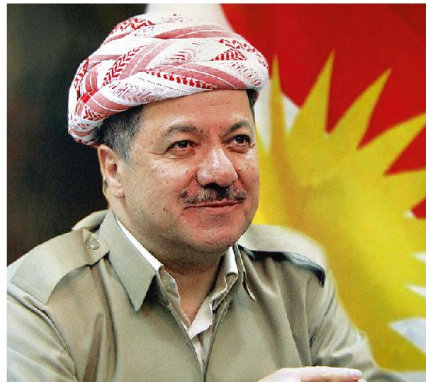
Der kurdische Regionalpräsident Masud Barzani.

gen Anlagen auf den Feldern Bai Hassan und Kirkuk. Dort werden täglich bis zu 400 000 Barrel Rohöl gefördert. Der Ausserminister der kurdischen Regionalregierung Falah Mustafa Bakkir erklärte dazu: «Ministerpräsident Maliki hat einseitig und unrechtmässig das Budget der Region Kurdistan gekürzt und die Gehaltszahlungen an die Beamten eingestellt. Wir mussten handeln, um die Dienstleis-