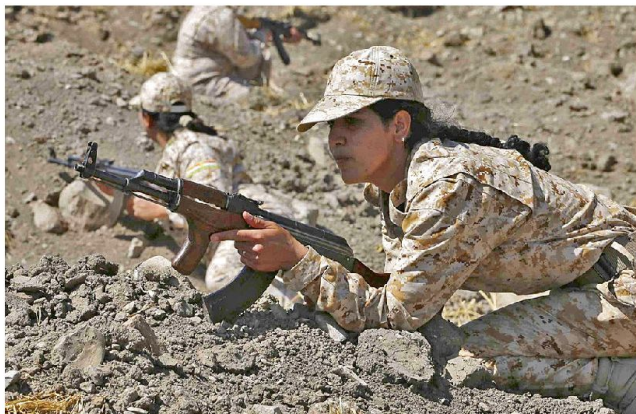
Wie in der IS kämpfen auch zahlreiche Frauen mit den Peschmerga.

Doch ein unabhängiges Kurdistan stösst auch bei anderen Mächten auf Widerstand. So machte US-Aussenminister Kerry die Position der Weltmacht mehr als deutlich: «Ein Auseinanderbrechen des Iraks muss unter allen Umständen verhindert werden». Beachtenswert auch die Position des schwarzen Schafes der Region, dem Iran. Für Teheran hat ein intakter irakischer Staat absolute Priorität. Das Mullahregime ist ebenfalls an einer Weiterführung der Zentralregierung in Bagdad, selbstredend unter schiitischer Führung, interessiert. Präsident Rohani spekuliert vielleicht sogar darauf, eine iranische Unterstützung des Irak gegen US-amerikanische Zugeständnisse auf anderen Feldern – zum Beispiel im Atomstreit – einzutauschen. Auf alle Fälle gilt für die gesamte Welt, Türkei, Iran und