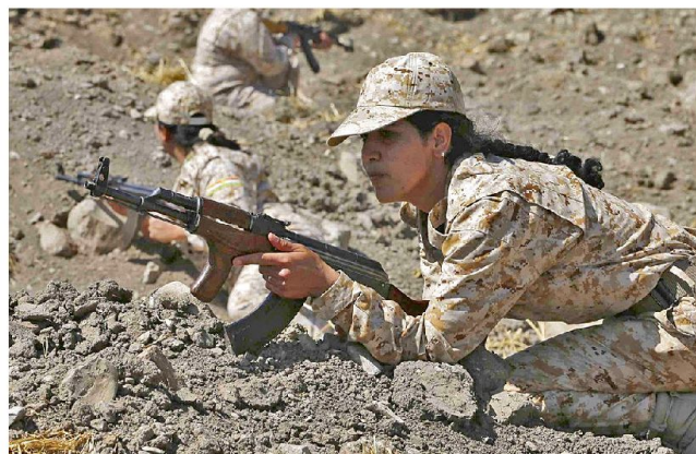
Wie in der IS kämpfen auch zahlreiche Frauen mit den Peschmerga.