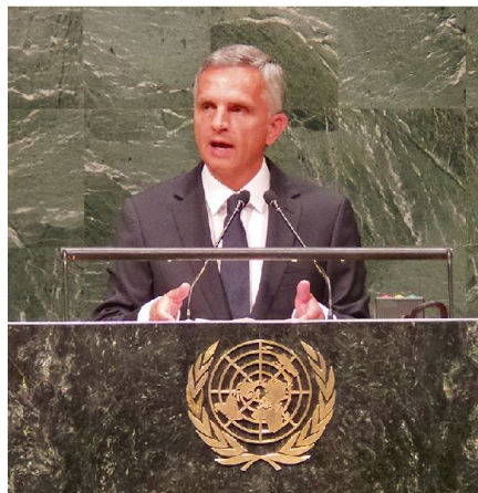
Rede anlässlich der 69. Generalversammlung der UNO in New York, 24. bis 26. September 2014.

gesetzt werden. In Basel am Ministerrat konnten wir jedoch einen Konsens erreichen zu einer Deklaration des Rates, in dem sich die 57 zur Weiterführung des