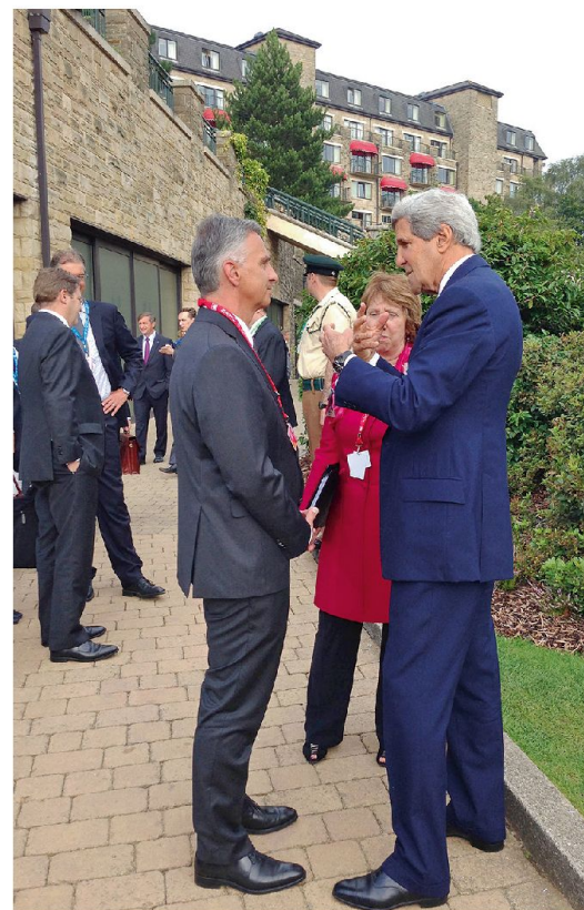
Treffen mit John Kerry (USA) und Catherine Ashton (EU) beim Gipfeltreffen der NATO in Newport (Wales) am 5. September 2014.

Die Ukraine-Krise hat aufgezeigt, dass grundsätzliche Annahmen zur europä-