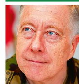
KKdt André Blattmann Chef der Armee 3003 Bern

* Gekürzte und leicht angepasste Fassung des Beitrages CdA im Blog der Generalstabsoffiziere von Dezember 2014.