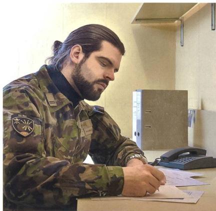
Ein Sprachspezialist-Offizier analysiert im Führungsraum der Einsatzzentrale Aussagen aus Befragungsprotokollen einer Übung und beurteilt die Glaubhaftigkeit der Aussagen.

Die Schweizer Armee verfügt mit den Ssp Of über eine spezielle Ressource, die sie bei Bedarf zum Schutz der eigenen Truppen und der Bevölkerung einsetzen kann. ■