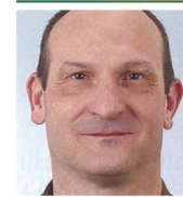
Brigadier Marco Schmidlin Kdt FU Br 41/SKS FU Br 41/SKS 8180 Bülach

mandant der Ssp Kp in der Lage, mit seinen Ssp Of gleichzeitig an vier Standorten mit je einem Ssp-Detachement eine Befragungs- und Auswertestelle (BAS) ein-