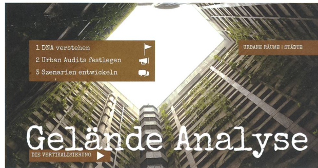
Dem wahren Gesicht des Geländes Herr werden.

Der Blick auf ein modernes urbanes Gelände erfordert eine neue Perspektive und eine spezifischere Analyse als der Blick auf