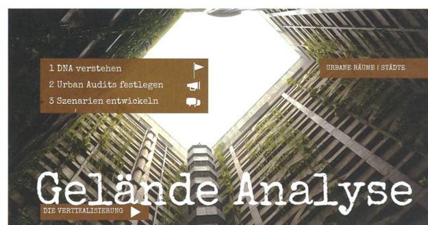
Dem wahren Gesicht des Geländes Herr werden.

Charakteristiken einer jeden Stadt bzw. Agglomeration zu erfassen. Wenn die DNA einmal mittels eines Audits ermittelt wurde, muss man darangehen, Szenarien für die Zukunft auszuarbeiten. Diese Szenarien bilden die Grundlage, um daraus Konsequenzen für die verschiedenen Interventionsbereiche in