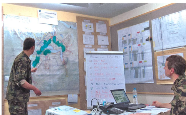
Der Chef Einsatz L Flab Lwf Abt 5 orientiert am Lagerapparat.

In der zweiten Wochenhälfte erfolgte dann die EBA für die «CHESS», unter der Leitung des Kdt Flab K Gr 2, Oberst