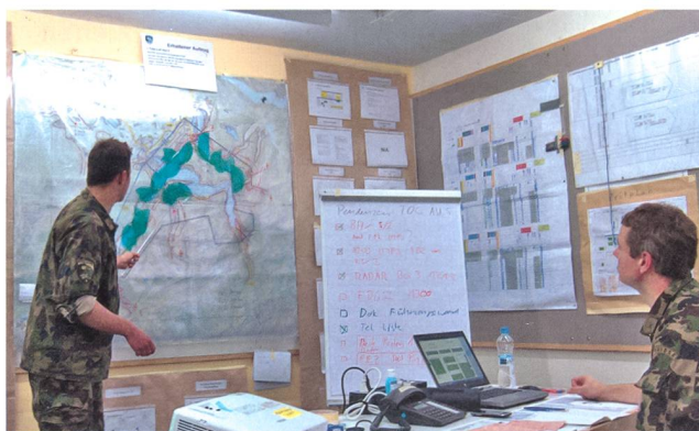
Der Chef Einsatz L Flab Lwf Abt 5 orientiert am Lagerreport.

In der zweiten Wochenhälfte erfolgte dann die EBA für die «CHESS», unter der Leitung des Kdt Flab K Gr 2, Oberst