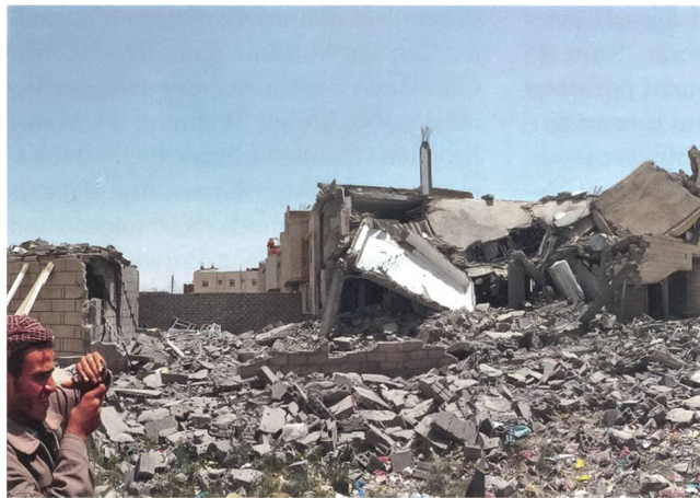
Spuren des Krieges in Sanaa.

Aus Angst vor Abspaltungsbewegungen im Land der 70 000 Moscheen, gingen die Regierungen oft auch gewaltsam gegen die Zaiditen vor. Sie liessen deren Büchereien schliessen, religiöse Gemälde und Symbole zerstören und verboten das Fest Ghadir Khumm. Im schiitischen Islam gedenkt dieser Tag der Bestimmung Alis zum Nachfolger durch den Propheten Moha-