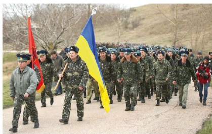
In Sewastopol verweigert die 204. Fliegerbrigade der Ukraine die Kapitulation. Ohne Waffen marschieren die Männer Russlands Spezialeinheiten entgegen.