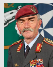
General Hans-Lothar Domröse, AJFC Brunssum