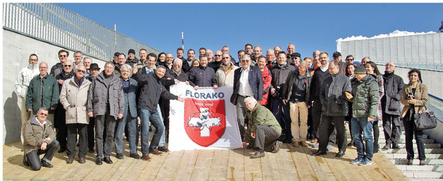
Jubiläum zehn Jahre FLORAKO vom 16. März 2014, ehemalige und aktive FLORAKO Mitarbeiterinnen und Mitarbeiter.

Vor genau zehn Jahren wurde das neue FLORAKO von der Luftwaffe in Betrieb genommen. Die offizielle Übergabe an die Benutzer fand am 17. März 2004 statt. Das äusserst komplexe FLORAKO System wurde während acht Jahren evaluiert. Die Arbeiten begannen 1992 und erreichten im Jahr 1998 die Beschaffungsreife. 1998, 1999 und 2004 wurden die Beschaffungsbotschaften den eidgenössischen Räten vorgelegt. Dazu gehörten speziell für die Schweiz entwickelte detaillierte Spezifikationen. Die Projektleitung unter der Führung der armasuisse setzte sich weiter aus Vertretern der Luftwaffe, des Planungsstabes, der RUAG, der Skyguide und weiteren Bundesstellen zusammen. Nach den Kreditbewilligungen wurde das System entsprechend den durch unsere Fachleute ausgearbeiteten Spezifikationen für unser Land gebaut. Damit verfügte die Schweiz bei der Inbetriebnahme über das wirklich modernste System. Zusammen mit den notwendigen Bauten umfasste das Budget etwa 1 Mia CHF. Beteiligte Fir-