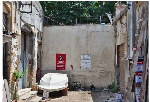
Abb. 2: Grenze durch Nikosia.

Seit den 70er Jahren treffen sich Präsi-denten/Vertreter des Südens mit solchen des Nordens – wie man scherzhaft zu sagen pflegt – zum Kaffeekränzchen, ohne dass dabei die heissen Eisen wie etwa Eigentumsfragen wirklich angegangen wür-den. Bedenkt man, dass die junge grie-