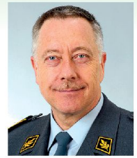
Geschätzte ASMZ-Leserinnen und Leser

Ende März durfte ich 23 junge Kameraden ins Korps der Generalstabsoffiziere aufnehmen. Die frisch brevetierten Offiziere sind ca. 1980 geboren. Also noch mitten im Kalten Krieg. Unsere Armee verfügte damals über einen Effektivbestand von 800 000 Soldaten, 260 Kampfflugzeugen und 800 Artilleriegeschütze. Als die Kameraden dann in die Primarschule kamen, fiel die Berliner Mauer und kurze Zeit später ging die Sowjetunion unter. 1991 prallten in der irakischen Wüste über eine Million Soldaten in einem konventionellen Krieg aufeinander. In den Jahren 1999 bis 2001 traten die Junioren dann in die Rekrutenschule ein. Von der Intervention im Kosovo bis zu 9/11 hat sich in diesen drei Jahren viel verändert. In der Schweiz befanden wir uns derweil im Umbruch zwischen der «Armee 95» und der «Armee XXI». In mehreren Schritten reduzierten wir die Bestände auf 450 000, 380 000 und schlussendlich 200 000 Armeemitglieder. Aus der Dissuasion wurde «Sicherheit durch Kooperation». Währenddessen sammelten unsere jungen Kameraden Erfahrungen als Kompaniekommandanten und nahmen die Laufbahn als Generalstabsanwärter in Angriff. Mit der WEA reduzieren wir den Bestand weiter auf noch 100 000 Armeemitglieder und wir werden – sofern der Gripen beschafft werden kann – künftig noch 54 Kampfflugzeuge haben. Und jetzt? Nach der Intervention auf der Krim spricht die ganze Welt plötzlich wieder von alten, bekannten Mustern. Zwei Erkenntnisse sind wichtig: