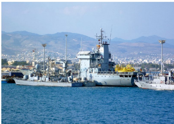
Abb. 4: Internationaler Marineverband der UNFICYP (Limassol, 03.07.11).

Der Norden Zyperns gilt als «Sondergebiet» der EU, da die EU Zypern (bislang) als unteilbar erklärte. Dies wäre ein Pfand gegenüber der Türkei, welche letztes