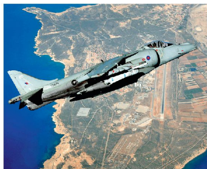
Abb. 3: RAF Harrier über der Akrotiri Air Base.

chisch-zyprische Generation Dreissig- und Vierzigjähriger die Invasion nicht erlebten, kann nicht verwundern, dass das Interesse am Norden und damit an einer Teilungslösung immer geringer wird. So hört man aus jenen Kreisen immer häufiger, dass man nicht bereit sei, den armen Norden durchfüttern zu müssen, also lieber auf die Gebietsansprüche verzichten wolle, nachdem sich die meisten Flüchtlinge in den von den Türkisch-Zyprern im Süden verlassenen Dörfern längst eingerichtet haben. Die aktuelle Finanzkrise, die mit Ausnahme der Banken Zypern noch nicht richtig erfasst hat, dürfte diese Einstellung nur noch verfestigen. Aus diesen Gründen