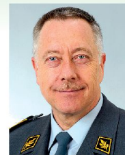
Geschätzte ASMZ-Leserinnen und Leser

Ende März durfte ich 23 junge Kameraden ins Korps der Generalstabsoffiziere aufnehmen. Die frisch brevetierten Offiziere sind ca. 1980 geboren. Also noch mitten im Kalten Krieg. Unsere Armee verfügte damals über einen Effektivbestand von 800 000 Soldaten, 260 Kampfflugzeugen und 800 Artilleriegeschütze. Als die Kameraden dann in die Primarschule kamen, fiel die Berliner Mauer und kurze Zeit später ging die Sowjetunion unter. 1991 prallten in der irakischen Wüste über eine Million Soldaten in einem konventionellen Krieg aufeinander. In den Jahren 1999 bis 2001 traten die Junioren dann in die Rekrutenschule ein. Von der Intervention im Kosovo bis zu 9/11 hat sich in diesen drei Jahren viel verändert. In der Schweiz befanden wir uns derweil im Umbruch zwischen der «Armee 95» und der «Armee XXI». In mehreren Schritten reduzierten wir die Bestände auf 450 000, 380 000 und schlussendlich 200 000 Armeeangehörige. Aus der Dissuasion wurde «Sicherheit durch Kooperation». Währenddessen sammelten unsere jungen Kameraden Erfahrungen als Kompaniekommandanten und nahmen die Laufbahn als Generalstabsanwärter in Angriff. Mit der WEA reduzieren wir den Bestand weiter auf noch 100 000 Armeeangehörige und wir werden – sofern der Gripen beschafft werden kann – künftig noch 54 Kampfflugzeuge haben. Und jetzt? Nach der Intervention auf der Krim spricht die ganze Welt plötzlich wieder von alten, bekannten Mustern. Zwei Erkenntnisse sind wichtig: