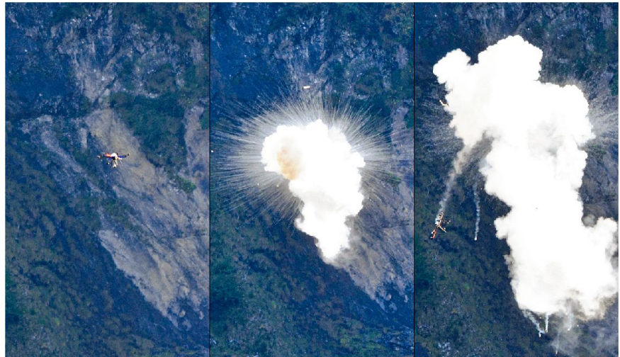
Abschuss eines VTUAV (Vertical Take-off and Landing Tactical Unmanned Aerial Vehicle).

Mit dem Boxer als Trägerfahrzeug wurde ein vollständig autonomer Mobile HEL Effector Wheel XX mit einer Ausgangsleistung von 5 kW realisiert, der im vorhandenen Bauraum auf maximal 20 kW