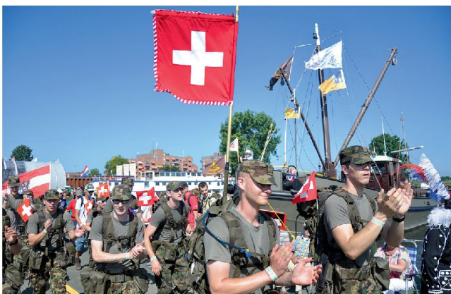
Die Schweizer Fahne begleitet unsere Delegation.