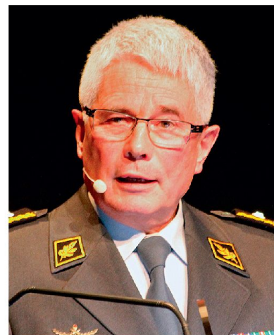
Divisionär Andreas Bölsterli, Kdt Ter Reg 2, bei seiner Ansprache.

punkte des Projektes Weiterentwicklung der Armee (WEA) und unterstrich die zentrale Bedeutung der Verteidigungsfähigkeit, die jedoch wesentlich breiter gefasst ist, als noch zur Zeit des Kalten Krieges. Im Vorder-