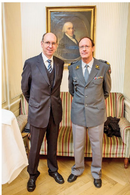
Der Präsident der Clausewitz-Gesellschaft Generalleutnant Herrmann mit dem Präsidenten der Schweizer Sektion, Oberst i Gst Walter Steiner.

rungsvorhaben verzichtet. Intern haben sich die Mitglieder der Sektion durchaus immer wieder mit strategischen Fragen und sicherheitspolitischer Aktualität befasst und mit dem allfälligen Erfahrungsgewinn aus solchen Diskussionen vielleicht ihr berufliches Tun beeinflusst. Es geht der Sektion weniger um den Schein