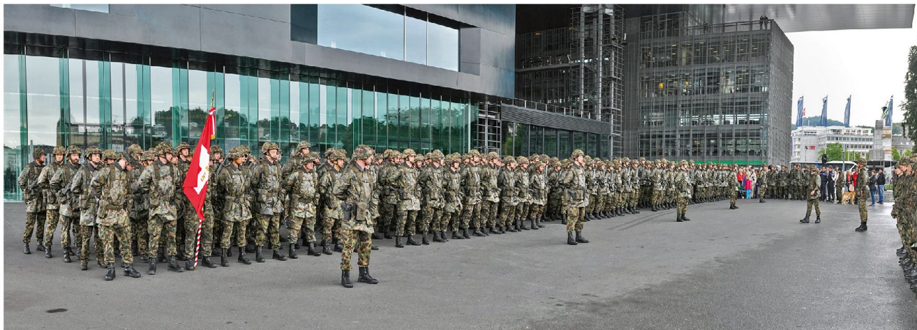
Unter dem schützenden Dach des KKL.

Die zahlreichen Zuschauer erlebten eine schöne und würdige Fahnenabgabe. Die ASMZ wünscht dem scheidenden Bat Kdt für seine militärische und zivile Zukunft alles Gute. Sch