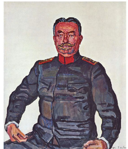
General Ulrich Wille. Porträt: Ferdinand Hodler

General Wille wurde zur Zielscheibe für Antimilitaristen, Dienstverdrossene und für jene, die unter sozialen Missständen litten. Dazu kommt auch ein eidgenössischer Charakterzug, der gegen eine Popularität von Wille sprach: Grundsätzlich ist der Schweizer nicht gerne gehor-