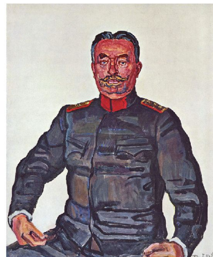
General Ulrich Wille. Porträt: Ferdinand Hodler

General Wille wurde zur Zielscheibe für Antimilitaristen, Dienstverdrossene und für jene, die unter sozialen Missständen litten. Dazu kommt auch ein eidgenössischer Charakterzug, der gegen eine Popularität von Wille sprach: Grundsätzlich ist der Schweizer nicht gerne gehor-