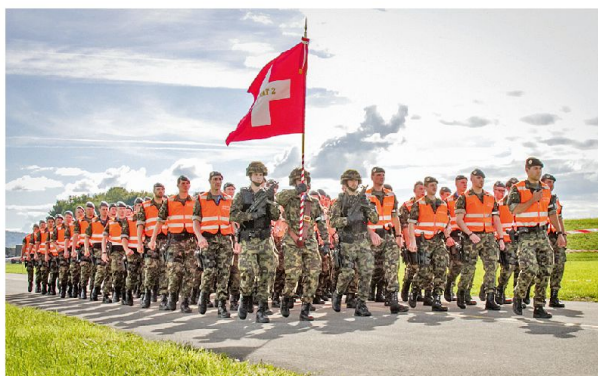
Aufmarsch des MP Bat 2 in Payerne.