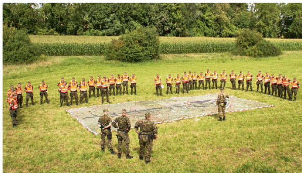
Der Einsatzleiter Front orientiert zwei Einsatzzüge.

Im Gegenteil: symbolisch für beherrzte Helfer und polizeiliche Priorisierung kann folgender Einzelfall der insgesamt rund 1000 Sanitätsfälle und gegen 200 polizeilichen Ereignisse erzählt werden: Am Samstag, 30. August 2014, brach ein