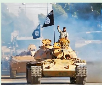
8 Der IS verfügt über schwere Waffen