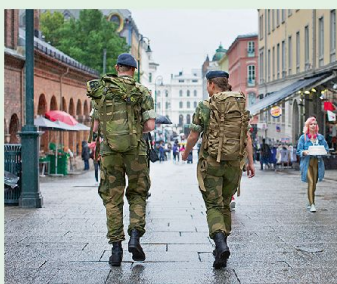
14 Wehrpflicht in Norwegen – in Zukunft auch für Frauen