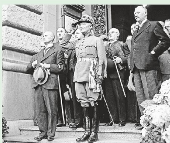
52 General Henri Guisan nach der Verteidigung