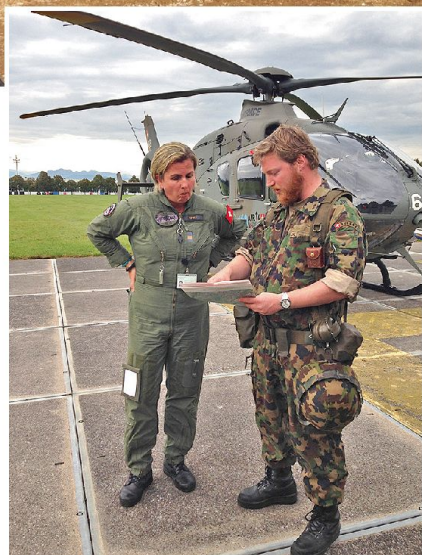
Absprache der Flugroute zwischen Art Schiesskommandant und Heli-Pilotin der LW

tritt der Panzerbataillone 28 und 29 aus deren Angriffgrundstellungen zu ermöglichen, wurden vom Kommandanten des Einsatzverbandes gemäss An-