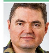
Brigadier Hans Schatzmann lic. iur. Kdt Infanteriebrigade 5 3380 Wangen an der Aare

tritt der Panzerbataillone 28 und 29 aus deren Angriffgrundstellungen zu ermöglichen, wurden vom Kommandanten des Einsatzverbandes gemäss An-