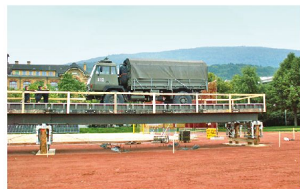
Abb.1 (oben): Rammgerät 97 auf Schwimmplattform, bereit zur Demonstration.