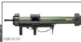
RGW 90 HH