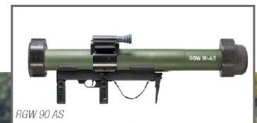
RGW 90 AS