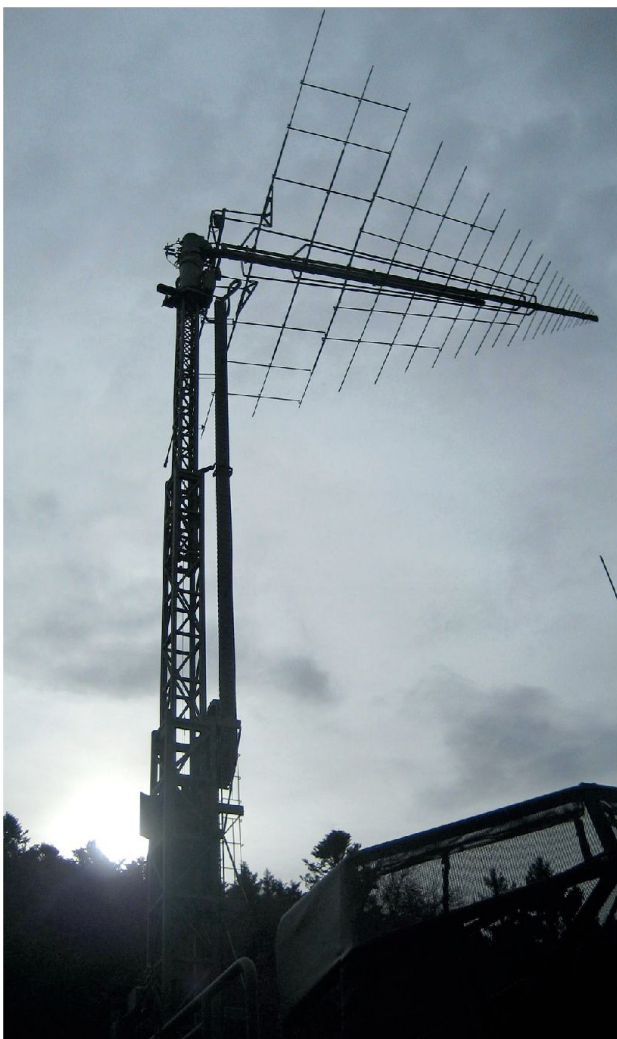
Im Modul «VERDE EW» lernt der Leistungsbezüger auch die Wirkung der Mehrzwecksender (Effektoren) kennen.

EKF 41» ist die faszinierende Chance, die Angehörigen unserer Armee mit einem modernen System für eine unterschätzte reale und aktuelle Bedrohung trainieren zu lassen.