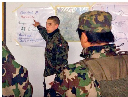
Befehlsgebung eines Zfhr.

Unteroffizierslehrgang zur Verfügung stehende Zeit führten zu Beginn des Praktikums zu einer Überlastung von Einheitsfeldweibel und Fourier. Der gezielte Einsatz der Zeitmilitär (z. B. Führung Material- und Munitionsmagazin) entlastete die Praktikanten und ermöglichte eine