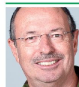
Brigadier Willy Siegenthaler Kdt LVb FU 30 VBS, Luftwaffe 6252 Dagmersellen

Noch wichtiger sind aber die Erkenntnis und der Grundsatz: Die Ausbildung im Lehrverband muss auch zukünftig streng und anforderungsreich sein – das erwarten unsere jungen Erwachsenen dieses Landes. Ebenso hat sich der Lehrverband den aktuellen gesellschaftlichen und politischen Rahmenbedingungen zu stellen. Dazu gehört die Bereitschaft, die Leistung des Lehrverbandes laufend zu analysieren und der Wille, daraus abgeleitete Massnahmen umzusetzen. Dies im Bestreben, stets das Optimum für unsere Miliz zu erreichen. Somit wird der Wandel auch in Zukunft steter Begleiter unseres Lehrverbandes Führungsunterstützung 30 bleiben. ■