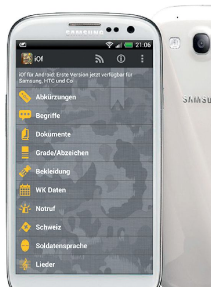
Android-Version von iOf.

den Gerüchten haben wir jedoch auch gehört und deshalb eine klare Stellungnahme auf unserer Webseite und in iOf publiziert. Weder haben wir von offizieller Seite ein Angebot erhalten, noch haben wir ein Angebot unterbreitet.