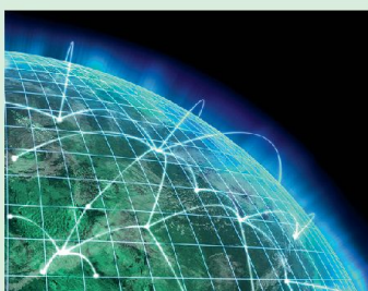
18 Neue Risiken im virtuellen Raum