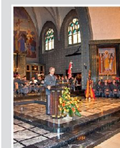
Promotion des GLG II/13