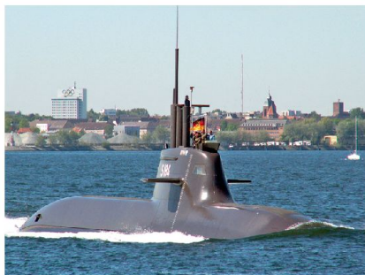
Die deutsche Werftindustrie ist im Bau konventioneller U-Boote führend. Hier die U 34 vor Kiel, die über einen luftunabhängigen Antrieb (AIP) verfügt.

Im Bau befinden sich ferner vier hochmoderne 6800 Tonnen Flugkörper-Fregatten der Klasse 125, die sich speziell für Luftabwehr-Einsätze in Operationsgebieten weit entfernt von Deutschland eignen. Diese Schiffe werden auch ein Zweibesatzungskonzept aufweisen und mit einer