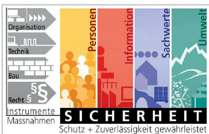
Grafik Sicherheit; Massnahmen und geschützte Einheiten.

übersichtlicher und vollständiger Form präsentiert. Das neue Reglement ist zugleich ein klar gegliedertes Hilfsmittel, um Basiswissen nachschauen oder auch an die Zielgruppen weitervermitteln zu können. Das gesamte Feld von Risiken und Bedrohungen über Rollen und Verantwortlichkeiten bis zu konkreten Sicherheitsmitteln wird abgedeckt. Welche Klassifizierungsstufen von Informationen gibt es? Welcher Stufe entspricht ein ausländisches Dokument, welches als «RESTRICTED» klassifiziert ist? Solche Fragen werden im Reglement einfach und übersichtlich beantwortet. Zusätzlich veranschaulichen