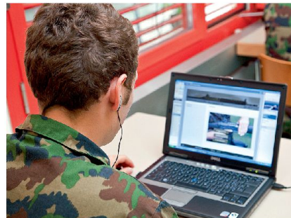
Soldat bei der Bearbeitung einer Lektion an einem E-Learning-Notebook.

Reglemente und Anordnungen der Schweizer Armee. Im Katalog werden dazu Hunderte Videos und über tausend Lerninhalte mehrsprachig geführt. Alles Gelernte, die Prüfungen, die Präsenzkurse und die erworbenen Fähigkeiten werden bis zur Entlassung gespeichert. Über die richtigen Filter bearbeitet und eingegeben, erlauben diese Daten massgeschneidertes Controlling der Ausbildung und der Bereitschaft. ■