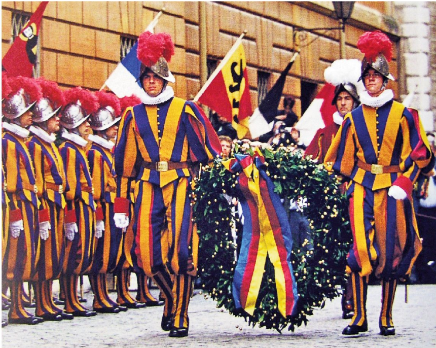
Kranzniederlegung am 6. Mai zur Erinnerung an den «Sacco di Roma» im Jahre 1527. Die Schweizergarde basiert auf einer Genehmigung des Bundesrates und rekrutiert sich durch persönliche Anwerbung im Rahmen eines zivilen Arbeitsvertrages.

Bild: Schaufelberger Walter, Begegnung mit der Päpstlichen Schweizergarde