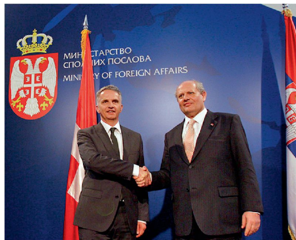
BR Burkhalter und Serbiens Aussenminister Ivan Mrkic besprechen am 12. Februar 2013 in Belgrad den OSZE-Vorsitz.

Wir haben unserem Vorsitz ein Motto gegeben: «Eine Sicherheitsgemeinschaft im Dienste der Menschen schaffen». Damit sprechen wir in einem Satz unsere