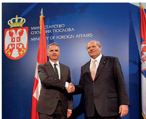
BR Burkhalter und Serbiens Aussenminister Ivan Mrkic besprechen am 12. Februar 2013 in Belgrad den OSZE-Vorsitz.

Es ist in meinen Augen eine sinnvolle Kombination, denn ich werde als Bundespräsident direkten Zugang zu den Staats- und Regierungschefs der OSZE-Teilnehmerstaaten haben und dadurch die politische Hebelwirkung für unseren Vorsitz verstärken können. Aber auch umgekehrt