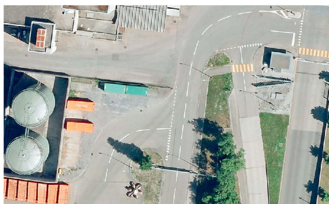
Ausschnitt CITIMAGE Thun

Weitere Information zum Produkt CITIMAGE finden sich unter www.citimage.ch