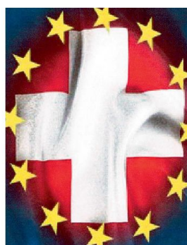
Eingekreist aber nicht verloren. Grafiken: Autor

Eigenständigkeit im Herzen der EU erscheint heute einer Mehrheit von Schweizern – und vielen EU-Bürgern – wie eine kleine, bedrohte Kostbarkeit. Über Gesetzeserlasse und die Rechtsprechung könnte die EU diese Kostbarkeit knacken. Die EU mag für grosse Länder nach wie vor bedeutsam sein. Ist sie es aber auch für ein kleines Land mit seiner Vielgestaltigkeit und schützenswerten Besonderheit wie die Schweiz? ■