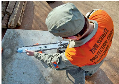
Im Zivilschutz liegt grosses Entwicklungspotenzial.

In einem umfassenden Gesetz zur Sicherstellung der Wehrgerechtigkeit müsste in aller Deutlichkeit gesagt werden, dass der Militärdienst Vorrang vor allen anderen persönlichen Dienstleistungen und vor der finanziellen Ersatzabgabe hat. In zweiter Priorität müsste die persönliche Dienstleistung im Zivilschutz und Zivildienst ermöglicht werden und nur bei gänzlicher Untauglichkeit oder anderer begründeter Verhinderung die Wehrpflichtersatzabgabe zur Anwendung gelangen.