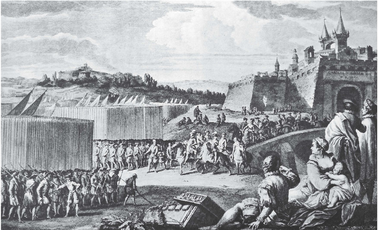
Rückzug von Meaux unter Oberst Ludwig von Pfyffer von Luzern im Jahre 1567.

Paul de Vallière: Treue und Ehre, Lausanne, 1940