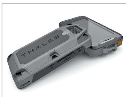
LTE™ Terminal von Thales.

Eine dritte wesentliche Eigenschaft bei taktischen Funksystemen betrifft die notwendige Robustheit der Endgeräte gegenüber Umwelteinflüssen, welche jedoch zu Abstrichen bei der Ergonomie führt. Die soeben genannten Eigenschaften sind für den Kampfeinsatz von zentraler Bedeutung. Allerdings zeigen sich diese dem militärischen Nutzer in «friedlichen» Übungen sowie auch bei subsidiären Einsätzen nicht. Er bemerkt vor allem den im Vergleich zum Smartphone fehlenden Komfort und die allenfalls fehlende Abdeckung in Form von fehlender Verbindung.