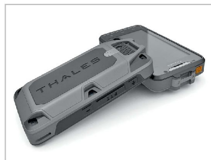
LTE™ Terminal von Thales.

Obwohl COTS-Produkte auf ersten Anblick kostengünstig beschafft werden können, ist deren Nutzen aber oftmals nicht auf militärische Einsätze ausgerichtet und somit nicht jederzeit bedarfsgerecht. Im Unterschied zum zivilen