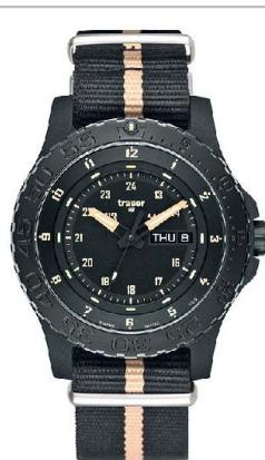
traser® H3 P 6600 Sand mit der robusten Doppelgehäuse-Konstruktion.