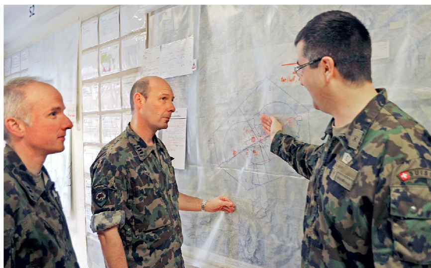
Stab und Kommandant im taktischen Dialog unmittelbar vor der Entschlussfassung in der Volltruppenübung SION33.

Die Milizkader erbringen den Tatbeweis, dass sie mehr leisten als der Durchschnitt. Diese Bereitschaft ist in der Wirtschaft wie in der Armee gefragt. Die praktische Führungserfahrung schafft einzig-