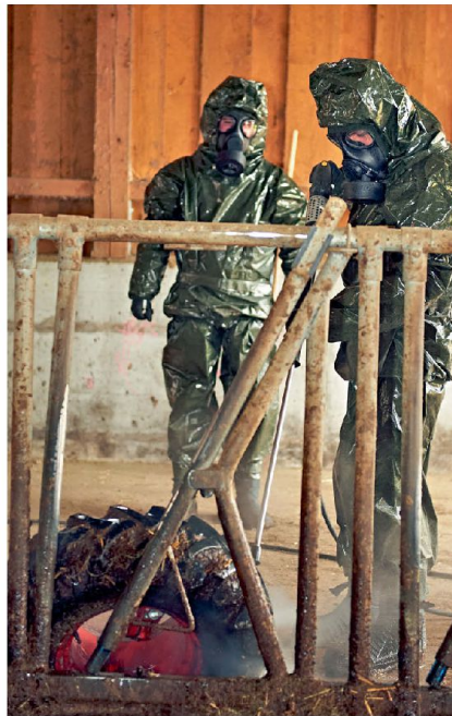
Seuchenbekämpfung: Veterinärsoldaten bei der Reinigung eines Schadensplatzes (Übungsszenario).

Die Vet Az OS inklusive praktischen Diensten ist eine für die Tierärztinnen und -ärzte massgeschneiderte Ausbildung, welche in dieser Form in der Schweizer Armee einzigartig ist. Im Rahmen dieser Offiziersschule werden Ausbildungen und Spezialisierungen ermöglicht, welche im Zivilen anerkannt und begehrt sind. Die angehenden Vet Az Of profitieren bereits während der sechzehnwoöchigen Vet Az OS von Schulungssequenzen mit Universitäts-Dozenten und zivilen Spezialisten