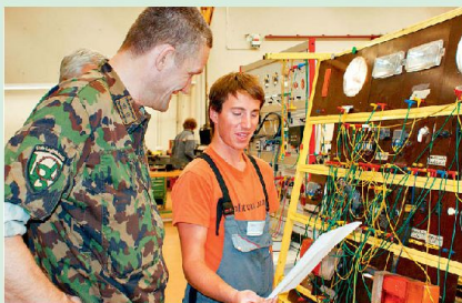
Die LBA, ein anerkannter und erfolgreicher Ausbilder.

Es ist grundsätzlich an uns, Rahmenbedingungen zu schaffen, die es ermöglichen, sich bei der Arbeit zu engagieren und sich entwickeln zu können. Wir müssen konsequent fordern und fördern, den Engagierten Perspektiven bieten. Wir Berufsmilitärs haben einen interessanten Job, vielseitige Inhalte, viel Selbständigkeit, gute Perspektiven, diverse Möglichkeiten uns weiterzubilden sowie Einsätze und Stellen im Ausland zu be-