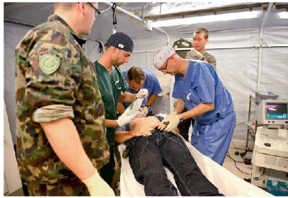
Die WEA sieht vier Spitalbataillone mit hoher Bereitschaft vor.

Die WEA stellt auch für die Sanität eine einmalige Chance dar, die Erkenntnisse aus Ereignissen der letzten Jahre umzusetzen und innerhalb der Armee wieder auf die zwingend notwendige Grösse und Leistungsfähigkeit anzuwachsen. Vier Spitalbataillone mit hoher Bereitschaft werden jederzeit zur Unterstützung der Bevölkerung, des zivilen Gesundheitswesens und natürlich der Armee eingesetzt werden können. Die prähospitalen Leistungserbringung wird fortlaufend modernisiert