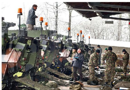
Material- und Fahrzeugfassung erfolgt mit WEA immer am selben Standort.

Neu erhält die Logistikbrigade 1 ein fünftes Logistikbataillon. Jedem Armeelogistikcenter wird mit der WEA ein Lo-