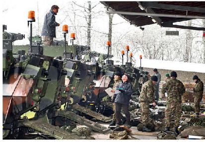
Material- und Fahrzeugfassung erfolgt mit WEA immer am selben Standort.

Neu erhält die Logistikbrigade 1 ein fünftes Logistikbataillon. Jedem Armeelogistikcenter wird mit der WEA ein Lo-