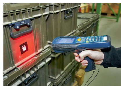
Etiketten mit Barcode sind eine Voraussetzung für durchgehende Logistikabläufe.

Das A und O der IT-gestützten Logistikprozesse ist die Qualität (Vollständigkeit und Aktualität) der verwendeten Daten. Der Materialfluss wird mit der mo-