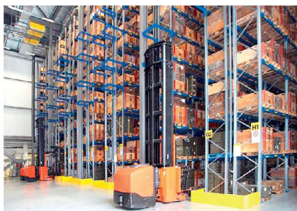
Oberes Bild: Schulung und Weiterbildung in der Anwendung von SAP.