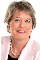
Nationalrätin Corina Eichenberger setzt sich für eine glaubwürdige Armee ein.

An der Generalversammlung 2013 der Sektion militärische Berufskader der Vereinigung der Kader des Bundes (VKB) konnte der Präsident, Div aD Waldemar Eymann,