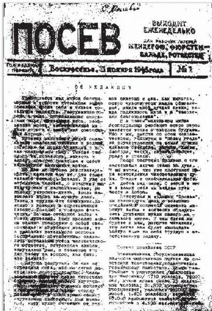
Die NTS sendet 1957 130 Forderungen an die sowjetischen Behörden.

sprachigen Zettel sogar innerhalb der Militäranlagen auftauchten, dürfte zumeist auf dort arbeitende DDR-Handwerker zurückzuführen sein. Während des Volksaufstandes in Ost-Berlin 1953 wandte sich die Organisation mit einer Extra-Ausgabe an die sowjetischen Soldaten: «Schiess nicht auf die unbewaffnete Volksmenge; sie verlangt nur das wovon auch Du träumst: Freiheit! Nicht völlig geklärt ist eine Meldung von «Possev» vom 12. Juli 1953; am 28. Juni seien im Sommerlager des 73. sowjetischen Schützenregimentes bei Magdeburg 18 Soldaten erschossen worden, weil sie sich geweigert hätten, auf die demonstrierenden Arbeiter zu schiessen. Bekannt ist, dass der NTS-Zentrale in West-Berlin ein entsprechender Zettel vorlag, der auf sehr hohe Geheimhaltung schliessen liess, andererseits die Namen der Toten aufzählte. Aufrufe in den letzten Jahren an die ostdeutsche Bevölkerung nach damaligen Zeitzeugen blieben ohne Echo, russische Behörden wiederum verweigern bis heute jede Mithilfe um Aufklärung.