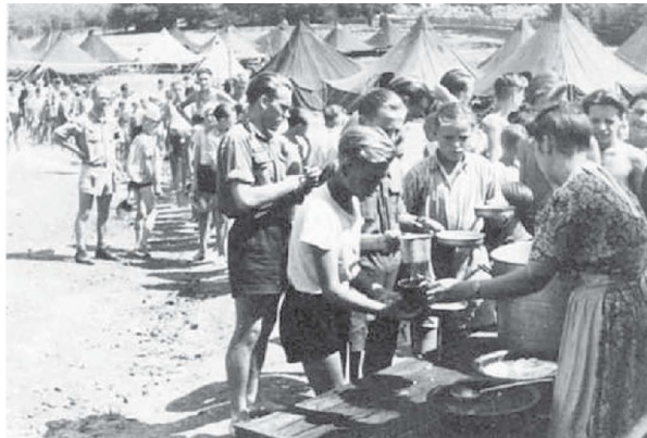
NTS-Lager Mönchhof bei Kassel, kurz nach dem Ende des Zweiten Weltkrieges.

Inhaltsähnliche Schriften der Widerstandsbewegung wurden per Ballon auch nach Polen gebracht, oftmals auch mit Hilfe polnischer Kohleschlepper in West-Berlin. Von den baltischen Staaten weiss man lediglich, dass nicht selten Flugblätter in wasserfesten Kunststoffhüllen an