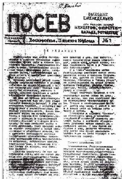
Die NTS sendet 1957 130 Forderungen an die sowjetischen Behörden.

bei Manövern wurde das Gelände zumeist eine Nacht zuvor oder während der Übung mit Flugblättern geradezu eingedeckt: Die russischen Soldaten mussten dann stets sofort in die Kasernen zurück, während man ostdeutschen Schulkindern das Einsammeln befahl. Andererseits bekamen SED-Funktionäre gefälschte Briefe des DDR-Parlamentspräsidenten, sowjetische Offiziere ihres Ortes mit einem grossen Blumenstrauß aufzusuchen und ihnen