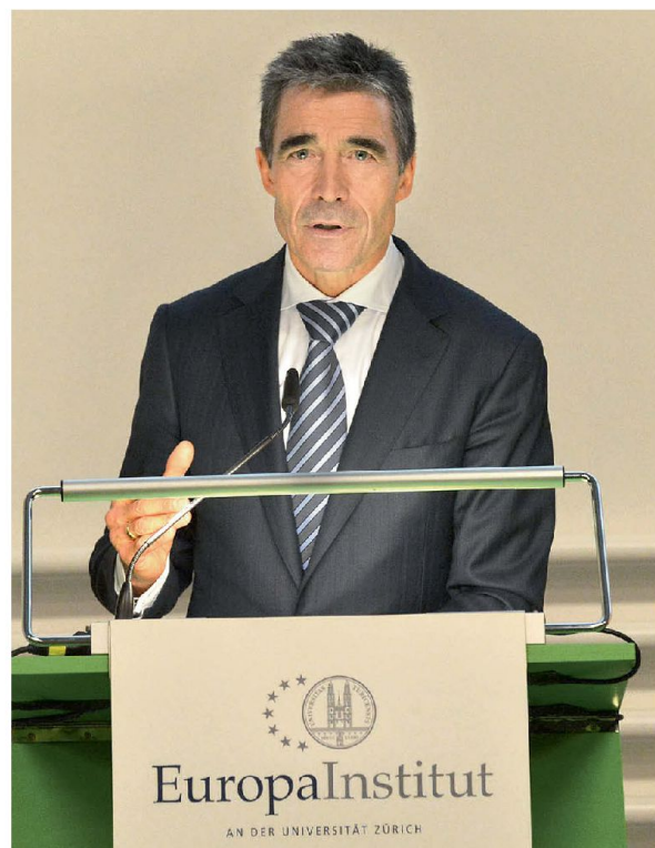
Der Generalsekretär der NATO, Anders Fogh Rasmussen, bei seinem Referat in Zürich am 22. November 2012.

wicklung unserer Armee informieren zu lassen. Geht es bei diesen Gesprächen um die Sicherstellung der weiteren Anpassung der Schweizer Armee an die Bedürfnisse der NATO?