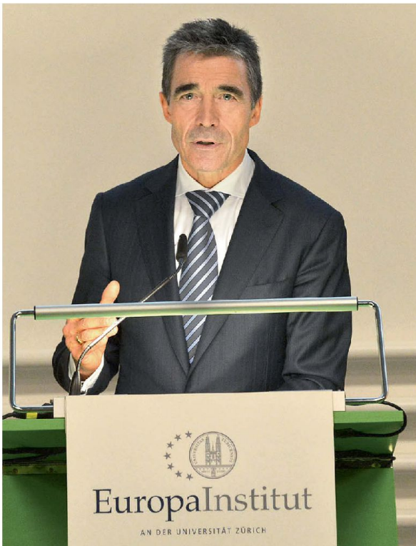
Der Generalsekretär der NATO, Anders Fogh Rasmussen, bei seinem Referat in Zürich am 22. November 2012.