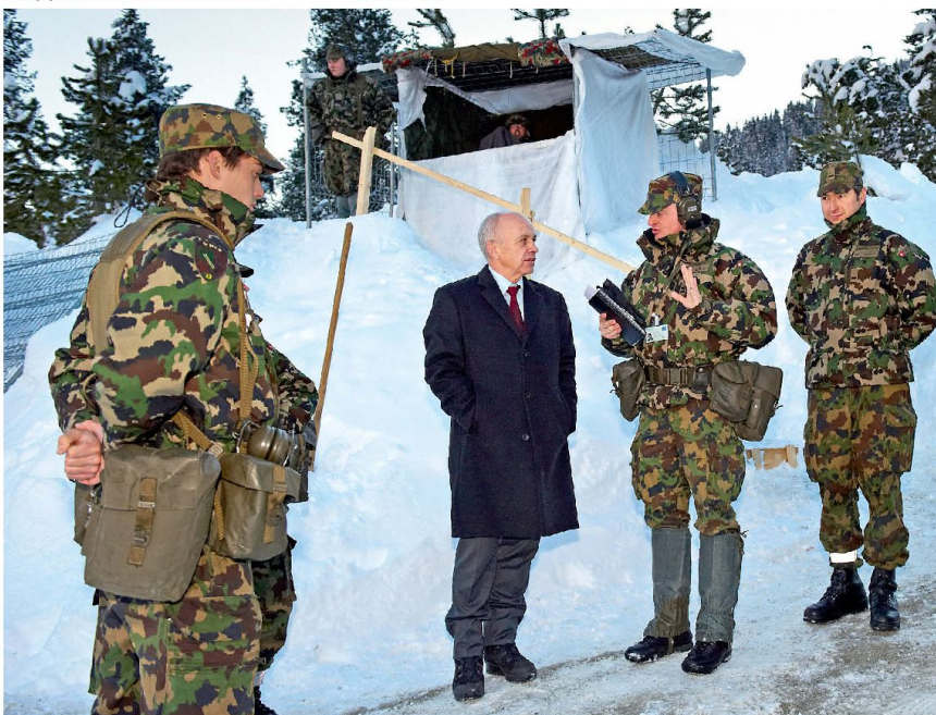
Truppenbesuch beim WEF.

Je mehr Substanz verloren geht, desto schwieriger wird es sein, junge Leute zu überzeugen, sich in der Armee zu engagieren. Die meisten jungen Leute bringen heute eine sehr gute Ausbildung mit, Rekruten ohne Berufslehre oder weitergehende Schulen stellen eine Minderheit dar. Dadurch kann die Armee auch sehr komplexe Systeme noch bewältigen, aber gut ausgebildete Leute sind kritisch und werden sich abwenden, wenn der Rahmen nicht mehr stimmt. Es ist eine staatspolitische Pflicht, die Soldaten, die wir aufbieten und die notfalls ihr Leben opfern müssen, so auszurüsten und auszubilden,