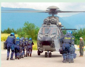
20 Selbstverständliche Zusammenarbeit Polizei–Luftwaffe