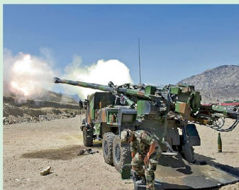
6 155 mm Selbstfahrgeschütz CAESAR