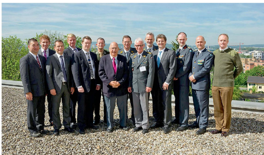
Referenten der Konferenz.

Die Bekämpfung ballistischer Raketen (Ballistic Missiles BM) kann nur im internationalen Verbund erfolgen. Die USA haben unter dem Namen NIMBLE TITAN ein Experiment (Wargame) gestartet, das die Interessen und Möglichkeiten von Staaten aufnimmt und gemeinsam Lösungen sucht. So sollen Sicherheitspolitik, Konzepte sowie Erfahrungen im Verbund festgelegt und konsolidiert werden. Aktuell sind regionale Experimente im Pazifik-Raum und in Europa sowie für die NATO erstellt worden. Die nächste