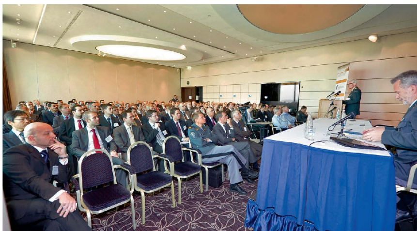
Eröffnung der Konferenz durch den Kommandanten der Luftwaffe KKdt Markus Gyga.

Bereits im Eröffnungsreferat des Kommandanten der Luftwaffe, der die Bedrohung aus dem globalen Umfeld hinunterbrach bis zu den Herausforderungen unterhalb der Kriegsschwelle, wurde klar, dass in den letzten Jahren ein Paradigmenwechsel stattgefunden hat: Wurde früher der Waffenträger bekämpft, geht es heute primär darum, die Angriffsgeschosse selbst zu treffen und ihre zerstörende Wirkung zu verhindern. Das Bedrohungsspektrum reicht von Raketen-, Artillerie-, Minenwerfer (RAM) Angriffen mit kleinster De-