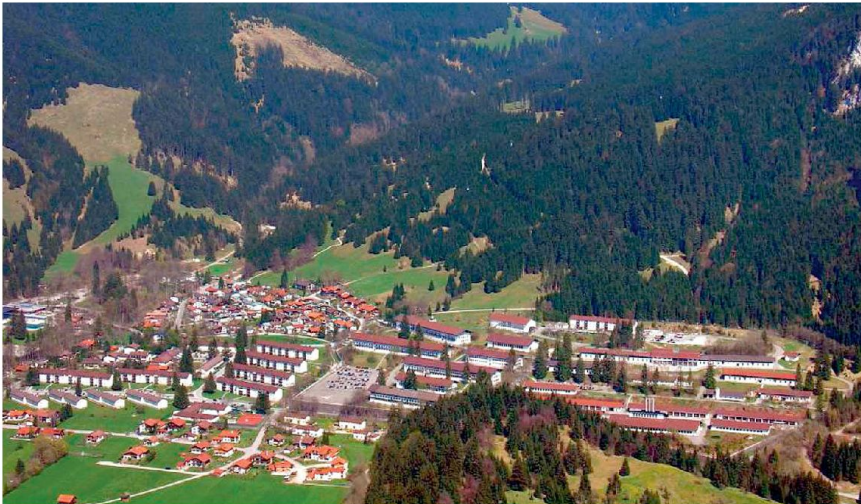
Die NATO-Schule befindet sich im Kasernenkomplex am rechten oberen Dorfrand, in den neuen Gebäuden ganz oben.

anlässe im Januar, das «NATO Defence Planning Symposium» und das «NATO Partnership Symposium», die etwa 450 Teilnehmer vereinigen.