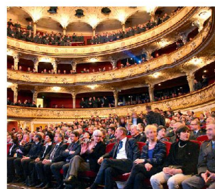
Die 850 Offiziere und Gäste der Gebirgsinfanteriebrigade 12 im Opernhaus Zürich.