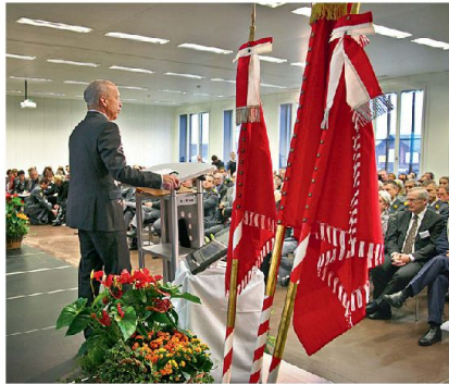
Bundesrat Ueli Maurer spricht zu den Mitarbeitenden HKA und zahlreichen Gästen.

Der Departementschef VBS ging in seiner kurzen Rede auch auf kommende politische Entscheidungen ein: «Im Juni wird dem Parlament ein Rüstungsprogramm fürs neue Kampfflugzeug unterbreitet – begleitet von einem Sparpro-