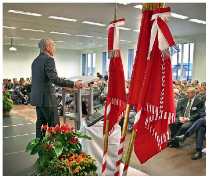
Bundesrat Ueli Maurer spricht zu den Mitarbeitenden HKA und zahlreichen Gästen.

Der Departementschef VBS ging in seiner kurzen Rede auch auf kommende politische Entscheidungen ein: «Im Juni wird dem Parlament ein Rüstungsprogramm fürs neue Kampfflugzeug unterbreitet – begleitet von einem Sparpro-