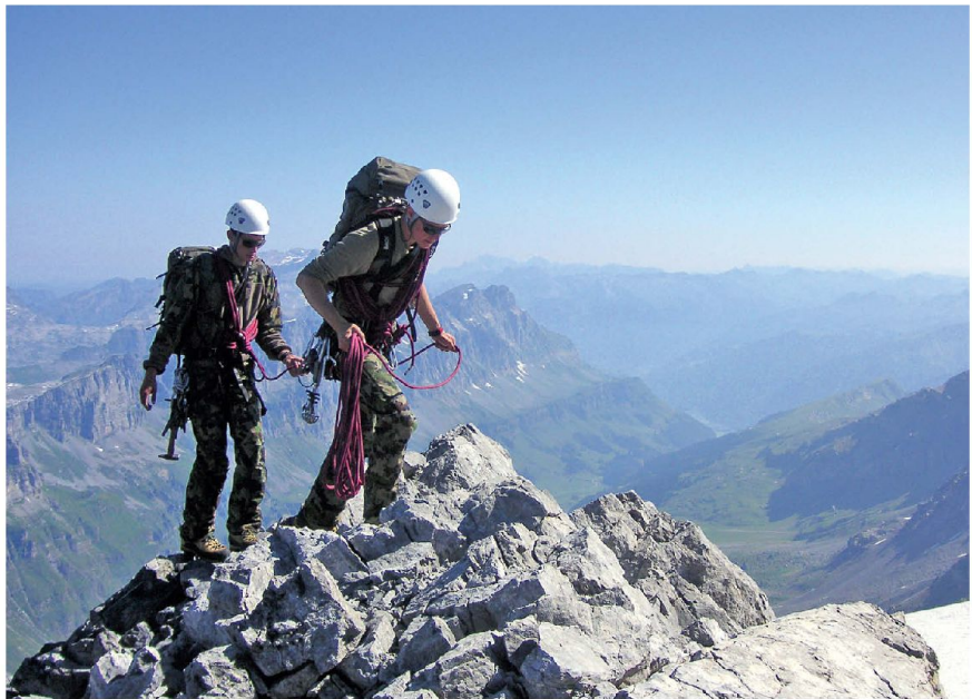
Eine der schwierigsten Disziplinen, aber auch eine der schönsten im Bergsteigen – das korrekte Führen eines Kameraden am kurzen Seil.