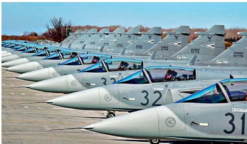
Staffel Gripen C der ungarischen Luftwaffe.

Üben dieser Abfang- und Identifikations-einsätze stellt eine der Kernaufgaben unserer Kampfpiloten dar. Für den Einsatz bei Tag und bei Nacht, bei jeder Wetterlage und in grossen Höhen, stehen heute 33 Flugzeuge F-18 «Hornet» zur Verfügung.